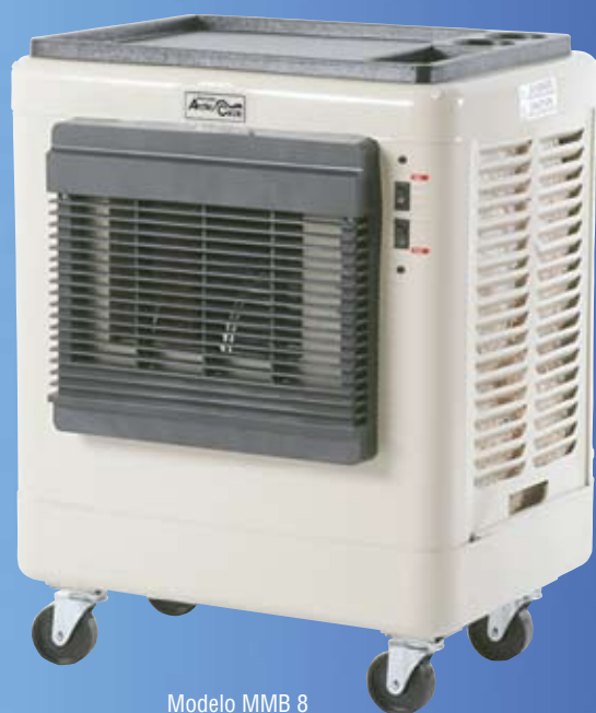
Modelo MMB 8

Disfrute la frescura de la manera más fácil y rápida.